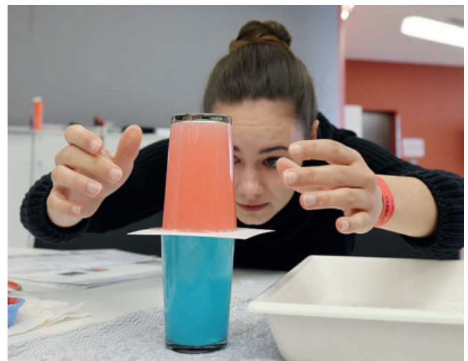
Spannende Experimente – einfach, schnell und kostengünstig umsetzbar